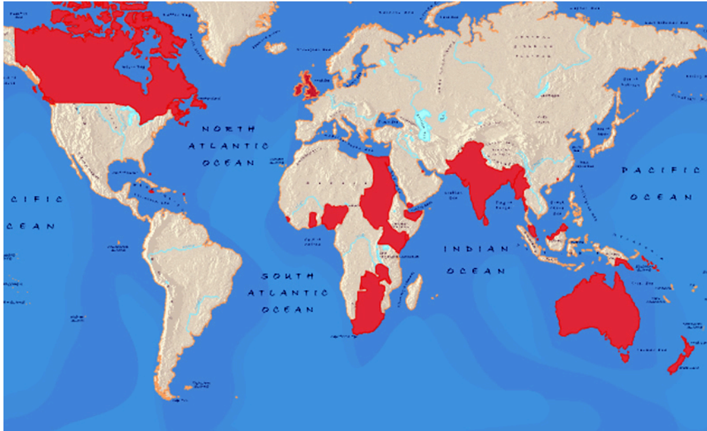
Карта номер восемь: Британская Империя в 1914 году