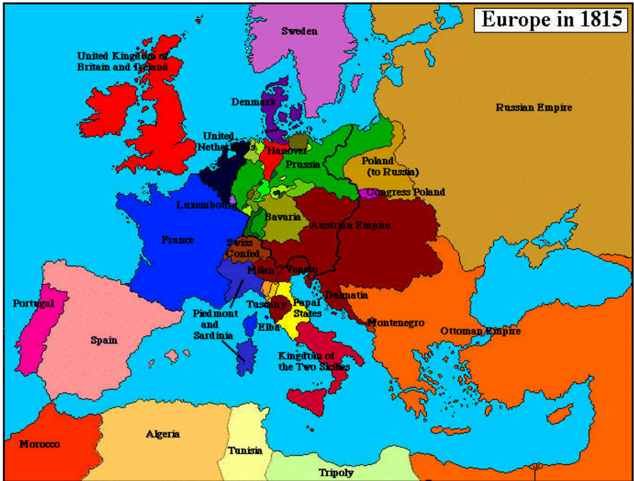
Карта номер два: Европа в 1815 году