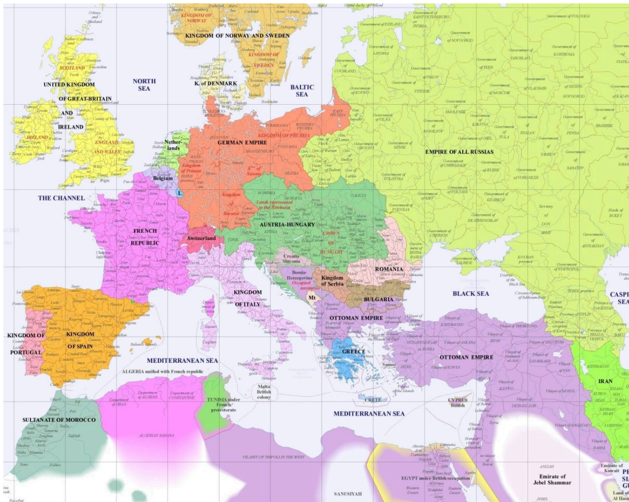
Карта номер пять: Европа и Средиземноморские страны в начале 20го века