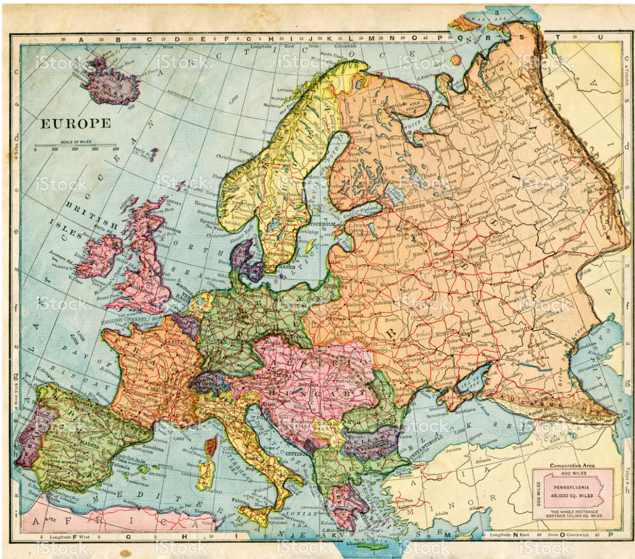
Карта номер три: Европа конца 19ого века