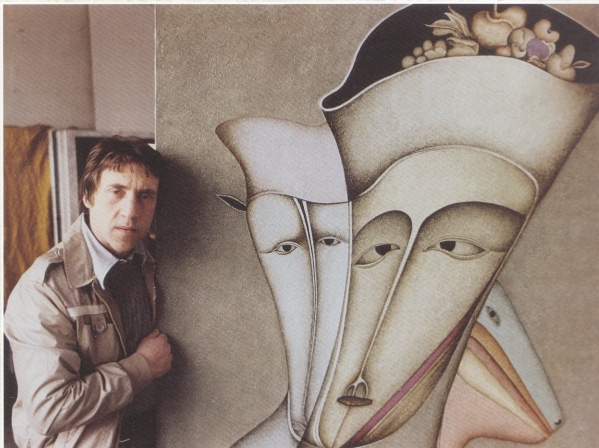
Владимир Высоцкий у своей любимой картины «Метафизический бюст» Михаила Шемякина. Впоследствии эта картина была повторена в бронзовом рельефе, который теперь является частью памятника Владимиру Высоцкому в Самаре Париж, 1979

В Москве только что вышла книга Владимира Соловьева «Не только Евтушенко» и в следующем месяце появится ее продолжение «Высоцкий и другие. Памяти живых и мертвых»