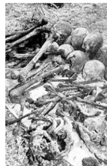
Одна из таких ям